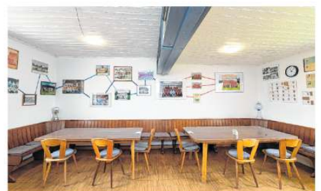
Nichts als Leere, wo sonst der Mannschaftsgeist gepflegt wird: Blick ins verwaiste „Stübli“ im Vereinsheim des SC Bubesheim.

Der Bayerische Fußball-Verband (BFV) ist mit 1,6 Millionen Mitgliedern der stärkste Landesverband. Innerhalb eines Jahres hat er 20 Vereine, 3861 Mitglieder und 181 Mannschaften verloren. Bei den Junioren auffällig war der Verlust an A-/B-Jugendteams (minus 134) gegenüber dem Zuwachs in den jüngeren Altersklassen (plus 87). Da der Stichtag der aktuellen DFB-Statistik der 1. Januar 2020 war, spiegeln sich mögliche Auswirkungen der Corona-Pandemie in den Zahlen noch nicht wider. (Quelle: DFB)