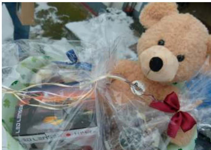
Der Preis für unsere Gewinnerin: Ein Präsentkorb gefüllt mit Inhalten für die ganze Familie.

Die Redaktion bedankt sich bei allen Teilnehmern der Online-Umfrage.