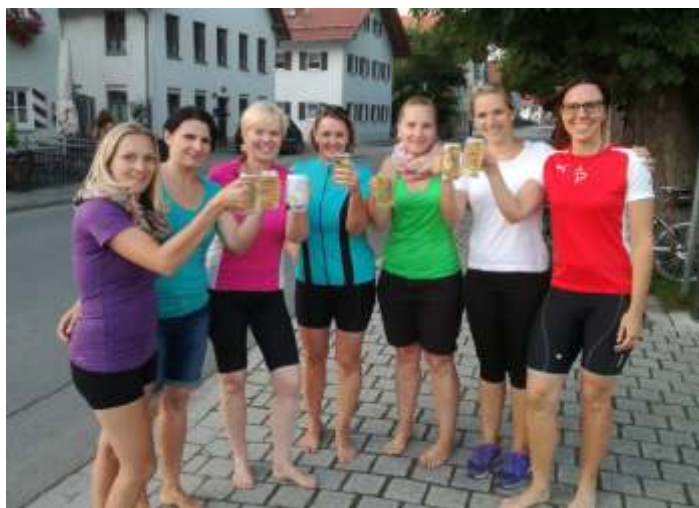
Ein gelungener Tag: Radlausflug und anschließende Einkehr in der Rössle-Stub'n in Ummenhofen