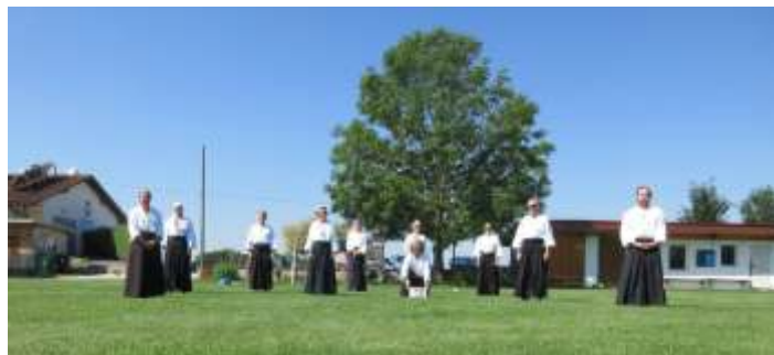
Aikido-Training auf dem Jengener Sportgelände

Im Sommer 2020 durften wir dann zumindestens im social distanced Training auf dem Jengener Sportplatz üben, was von einer stabilen Anzahl von jugendlichen und erwachsenen Aikidoka angenommen wurde. Dies führte auch zu einigen speziellen Sessions. Vor allem das zum Ersatz für die ausgefallene DAN Family Reunion organisierte Schwarzgurt-Training mit Gästen aus ganz Schwaben ist hier zu nennen.