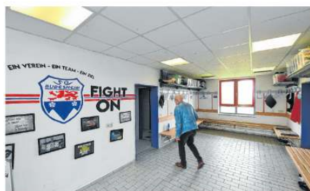
Nichts als Leere, wo sonst gefeiert oder Absteigsfrust hinuntergespült wird: eine Mannschaftskabine in Bubesheim.

Und an die Zeit nach der Pandemie. Wenn Stille wieder den Ruf der Spieler und dem Gemoser der Grantler weichen soll.