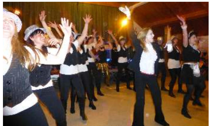
Impressionen von unseren Faschingsauftritten