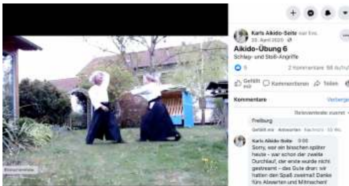
Facebook-Livestream eines Aikido-Freiluft-Trainings