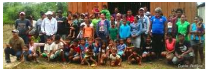
Waldschutzprojekt Jacundá mit wirtschaftlicher Unterstützung der ansässigen Bevölkerung

So auch das Waldschutzprojekt in Jacundá/Brasilien, das wir aktuell unterstützen. Das Projekt liegt im Nutzreservat Rio Preto-Jacundá im nordwestlich gelegenen, brasilianischen Bundesstaat Rondônia und verfolgt das Ziel, die ungeplante und illegale Abholzung und Waldschädigung zu verringern und dadurch Treibhausgasemissionen zu vermeiden. Dabei steht vor allem auch die nachhaltige Entwicklung des Ökosystems, sowie die Förderung der lokalen Gemeinschaft im Mittelpunkt. Das Projekt wurde nach der REDD+ VM0015 „Methodology for Avoided Unplanned Deforestation“, (v.1.1.), sowie nach dem CCB (Climate, Community and Biodiversity Standard) verifiziert.