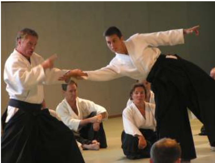
Training von Körper und Geist: Auf sich selbst achten und dann auf den Gegenüber.