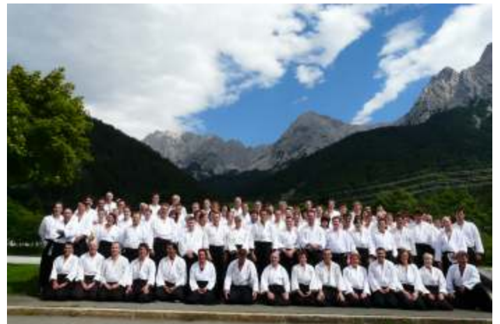
Aikido geht über die eigenen Trainingsgruppen hinaus: Durch seine Internationalität kann Aikido zur Völkerverständigung beitragen. Training von Körper und Geist:

Karl: Die Gründung der Europäischen Aikido Union durch André Nocquet hatte das Ziel, dass auch durch Aikido deutsch französische Freundschaften entstehen. Uns freut es sehr, dass wir Lehrgänge mit Teilnehmern aus der ganzen Welt besuchen dürfen und hoffentlich auch dieses Jahr wieder bei uns in Jengen ausrichten werden. Seit etwa 10 Jahren pflegen wir zudem auch rege Kontakte mit Japan, dem Ursprungsland des Aikido. Durch diese Internationalität kann Aikido zur Völkerverständigung beitragen.