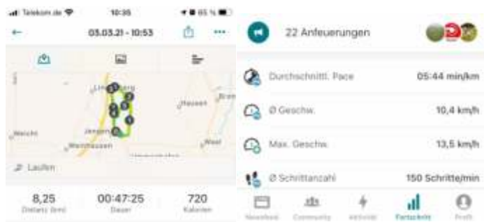
Beispiel für das App-unterstützte Einzeltraining mit Angaben zur Leistungseinschätzung